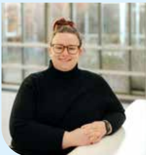
Raichael Hirschfeld Wäscherei Tostedt